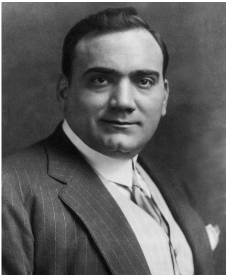
Caruso et son phonographe

Verdi qui s'avèrent être des Viva Victor Emmanuel Re d'Italia . Il part des structures classiques comme Nabucco, la Traviata, pour arriver à des drames psychologiques (Otello, Falstaff). Verdi est à l'opéra ce que Shakespeare est à la littérature anglaise !